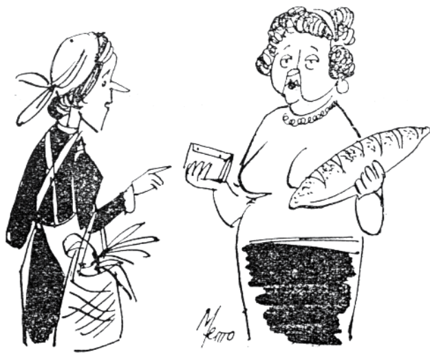
— От някой ден хляба ми се струва по-тежък. — А, не, кесята ти е по-лека...