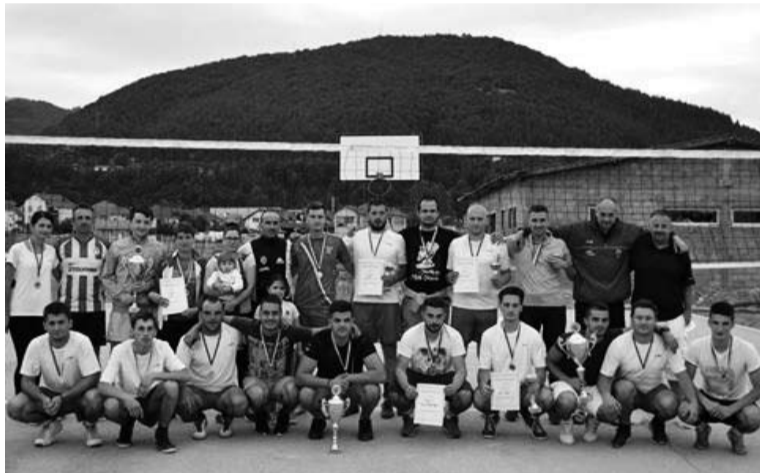
Най-успешните състезатели в турнира по волейбол за мъже

ните около малкия стадион на „Пескара“. На трето място се нареди „Брест“, който спечели малкия финал срещу „Ресторант Младост“ със 6:2. В турнира участваха 7 отбора. „Лав Маги“ стана победител в състезанието за кадети по футбол на малки врати,