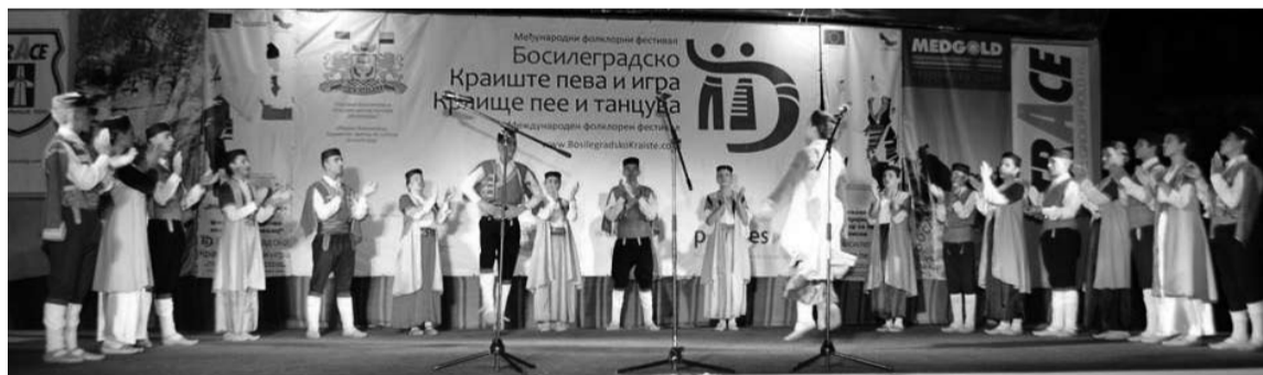
Фолклорен ансамбъл „Слободан Алигрудич“ - Подгорица, Черна Гора