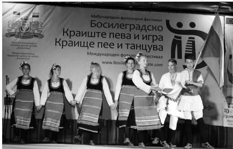
Танцов състав „Бистрица“ от село Соголяно, Кюстендил

Пред местните жители и гостите на града, които с удоволствие следяха изпълненията, представиха се общо 781 участници от 29 танцови и певчески състава от Сърбия, България, Босна и Херцеговина, Румъния, Македония и Черна гора. Сред тях бяха и трите танцови състава към „Центъра за култура“ и фолклорният ансамбъл към Спортното дружество „Младост“ от Босилеград. В мероприятията участва и Игор Глигоров от Виена, магистър по етно музика и изпълнител на народни песни, който е по потекло от село Рибарци, Босилеградско.