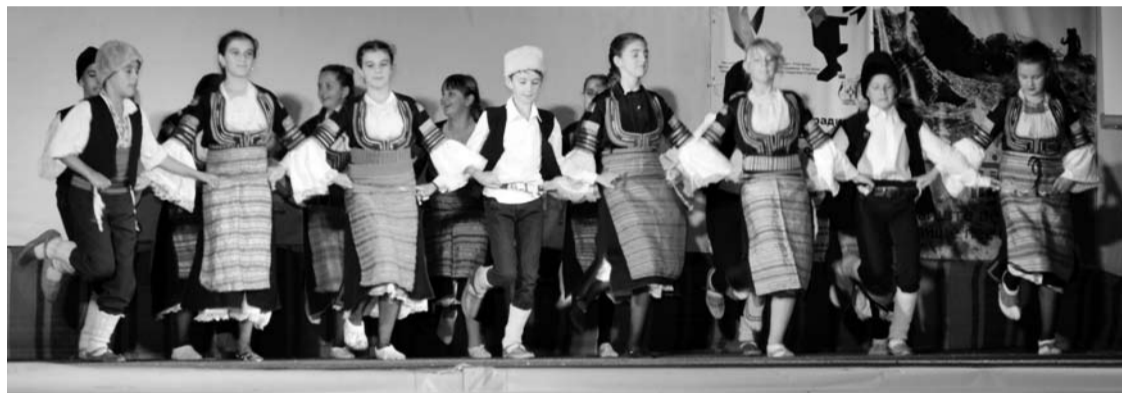
Най-малките танцьори от танцовия ансамбъл към Центъра за култура