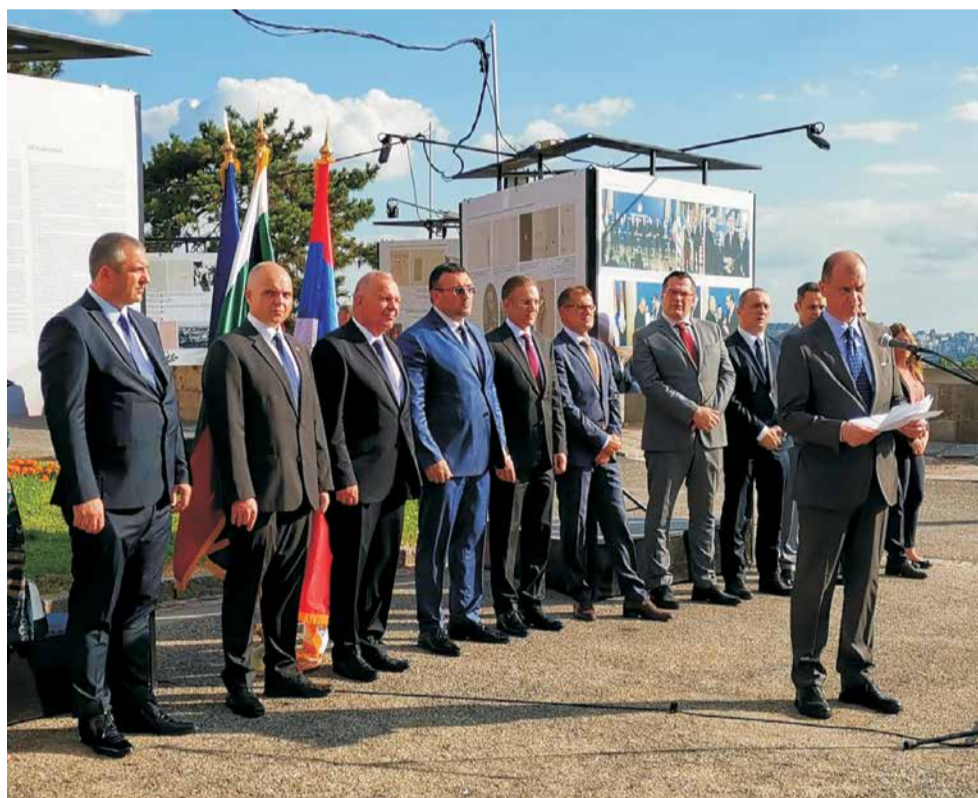
Наскоро в БЗБ