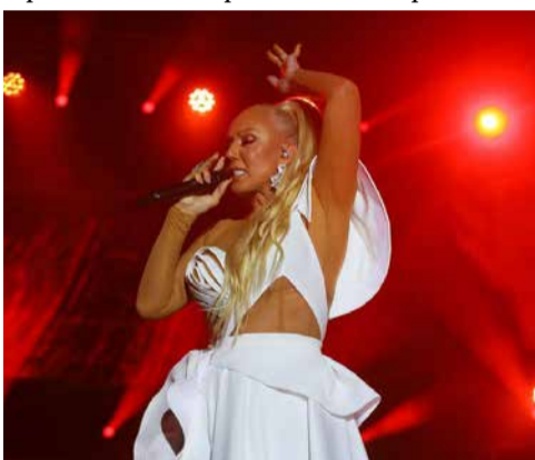
В организация на Червения кръст

Организатор на концерта е Алтернативна културна мрежа съвместно с Мелос Естрада. Спортно-туристическият център Цариброд също участва в организацията и промоцията на събитието. Общината няма да отделя средства за този спектакъл, понеже разходите поемат спонсорите. За организаторите Цариброд бе идеално място, защото разчитат и на гости от България. Те се надяват на концерта да присъстват и до 7000 души. Билетите са вече пуснати в продажба и в Сърбия и в България.