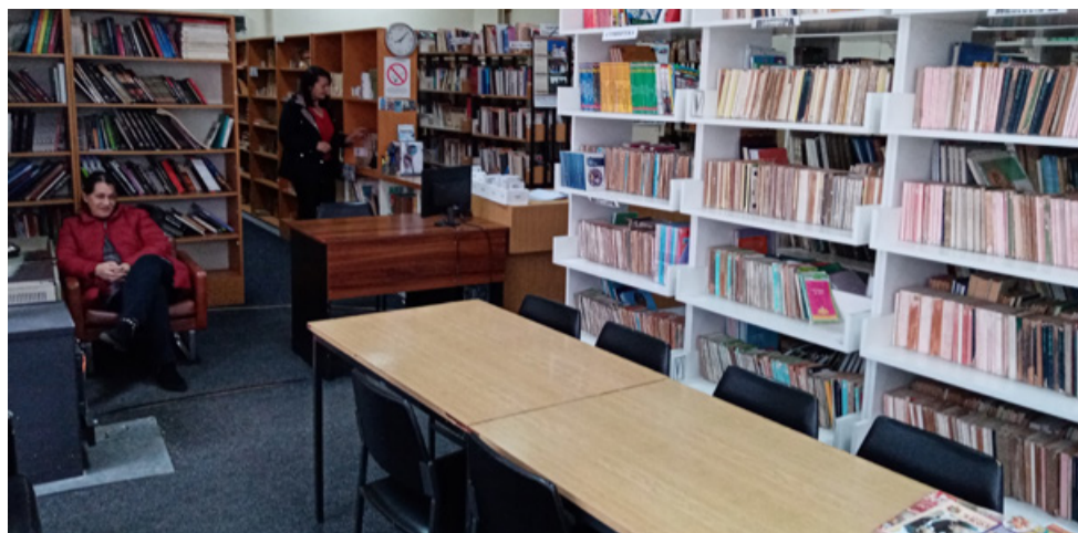
Народната библиотека „Христо Ботев“ в Босилеград