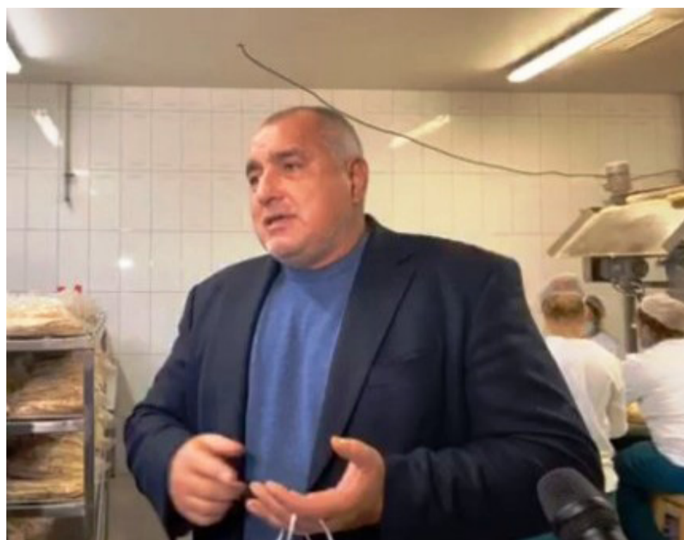
Българският премиер Бойко Борисов:

По повод Международния ден за правата на човека в Палата на Сърбия в Белград вчера бе организирана Конференция за влиянието на пандемията от коронавируса върху човешките права в Сърбия, на която бе поканен и председател на Националния съвет на българското национално малцинство в Сърбия