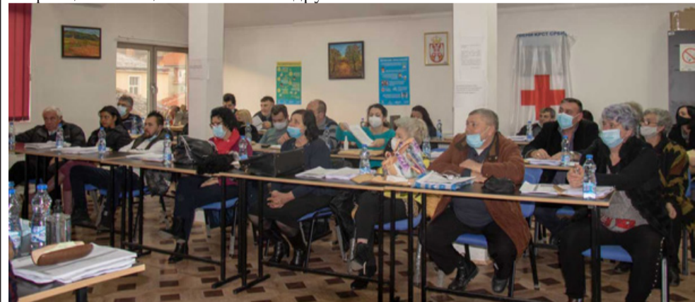
Уредовна сесия на местния парламент в Босилеград