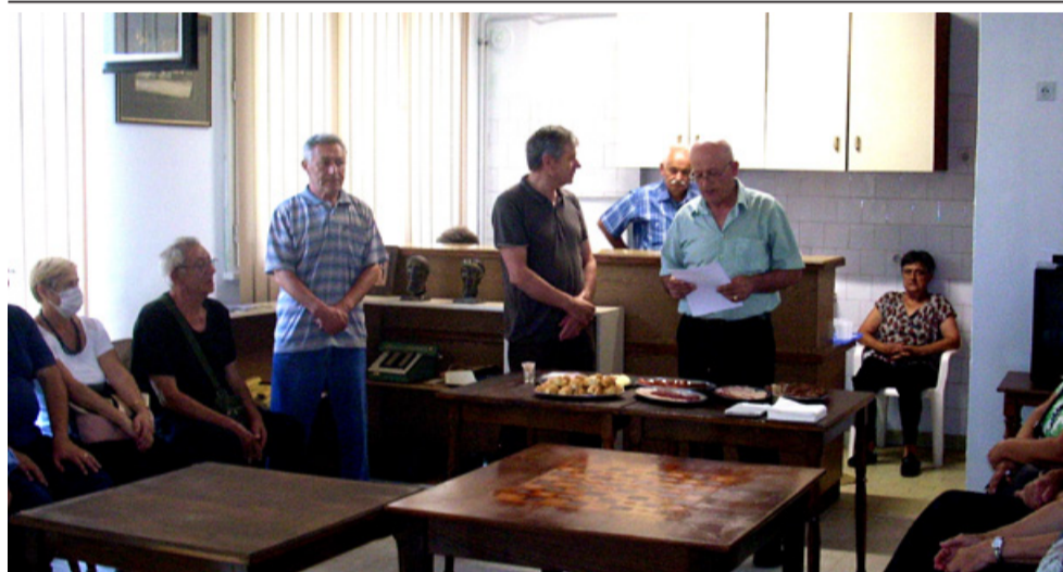
Ремонт в Клуба на Сдружението на пенсионерите в Цариброд