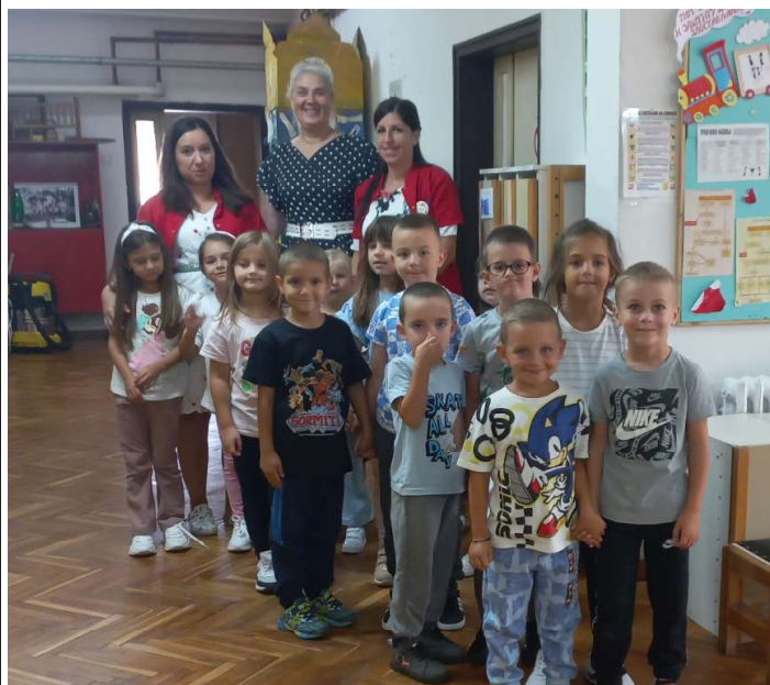
В Здравния дом в Босилеград