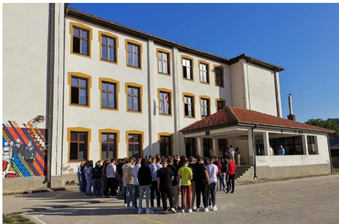
Стенопис на босилеградската гимназия