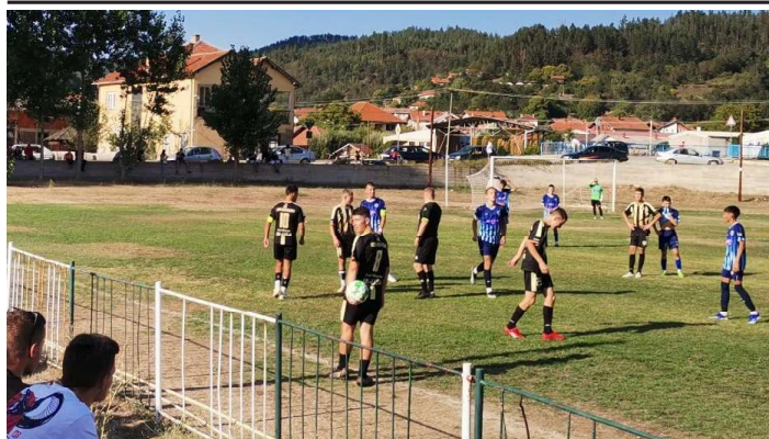
II Футболна лига на Сърбия за кадети - група Юг