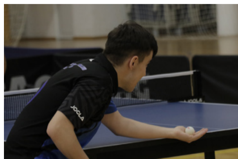
брод ще гостува още един отбор от Войводина „Галадска“ (Кикинда).

В 7-ия кръг на Регионална лига „Изток“ царибродските баскетболисти посрещнаха традиционния си съперник БК „Княжевац 1950“ от едно-