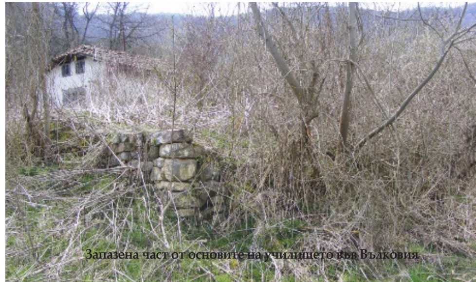
Запазена част от основите на училището във Вълковия

А днес? Поисках да направя снимка на училището. Няма го! Купчина камъни и паметника на загиналите вълковийчани в Балканските и в Първата световна война, който се намирал в двора на училището, свидетелстват, че някога тук е било училището на с. Вълковия. Възна от тъга ме залива и сърцето ми се свива. Как поколенията на будните и славолубивите вълковийчани не са се замислили и са допуснали да се разрути тяхната светлина – училището. И още по-лошо – не го е разрутил някой чужд човек, а те смите – вълковийчани! Да знаят какво са направили потомците им, старите вълковийчани биха станали от гробо-